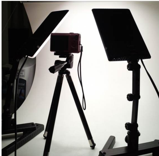
Fig. 1. Settings for photographing participant's hand. A digital camera with tripod, LED lights and photobox.